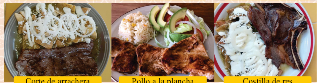
Corte de arrachera