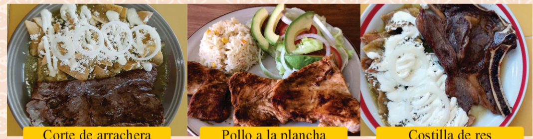
Corte de arrachera